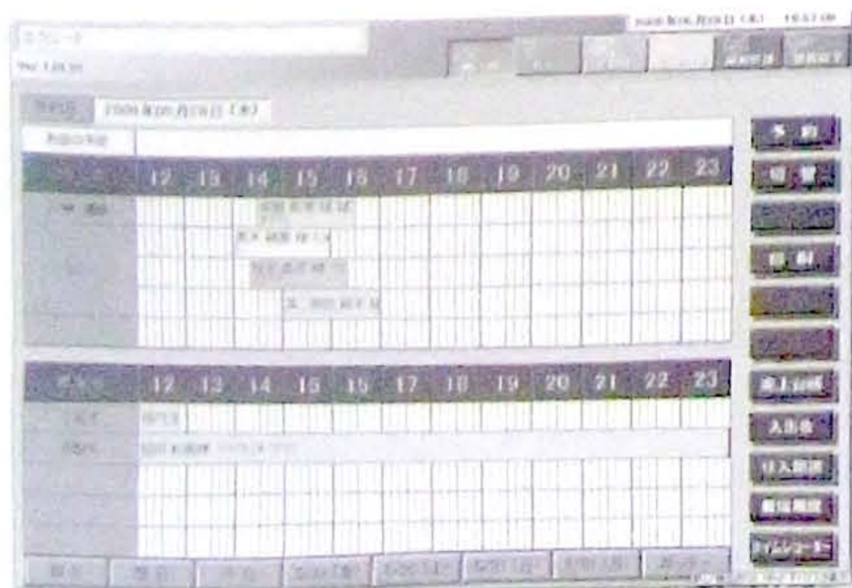
確認しやすい予約画面

飽和状態に近づいているとされるトリミングサロン業界。低価格化や高級化、新たなサービスの構築など他店との差別化への模索が続いているが、顧客管理の差から産まれる“経営の質の差”こそ、真の差別化ではないだろうか。